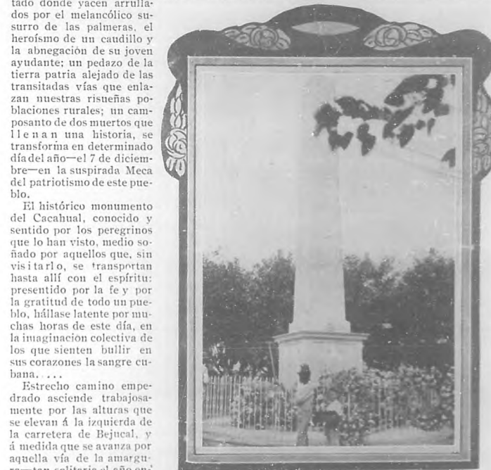
Monumento levantado en Cacahual á la memoria del héroe Anacleto Maceo y de su ayudante Pascual Gómez.

los ruidos del bosque semejan el galopar de los caballos en la horrible confusión de las cargas de Río Hondo y Paso Real; el estambrido del trueno le recordará el cañón liberador de Montemelo; la obscuridad del campo con la humedad de la lluvia será una evocación del solitario campamento del Roble; los ecos perdidos de la manigua, el gemir de las mujeres y el llanto de los tiernos infantes; pero ante el horror de una nueva esclavitud de la Patria, ya redimida, con toda seguridad que la pirámide del Cacahual se habría de bambolear y