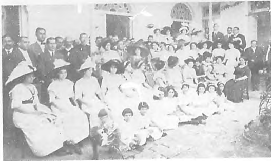
Centenario de la Fundación de Sagua la Grande.—Otro grupo de asistentes á la fiesta ofrecida por el señor Alfert.

Lo mismo en la "Cena de las Burlas" que en "Malvaloca", obras con que ha comenzado la temporada que en otras que le hemos visto interpretar, es el maravilloso artista de expresión única en cuya cara se dibujan claramente los más encontrados estados del alma agitada: el terror, el odio, la alegría, la venganza, con un solo gesto del actor están expresados de tal modo que el