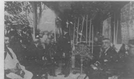
Al pie del monumento.—El catafalco

monumento que ha podido encerrar á quien no cupo con sus tropas en toda la extensión del territorio nacional.