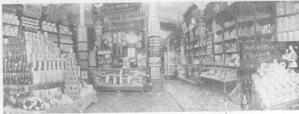
VISTA DEL DEPARTAMENTO DE VIVERES, CONSERVAS, CONFITURAS Y GALLETTICAS.